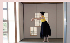
▲方丈庵でのダンスパフォーマンス

入間市博物館アリットでは、10月4日(土) 13:00~19:30/10月5日(日) 10:00~16:00 アリット秋のお茶まつり2014開催中!