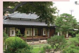
▲蕨市立歴史民俗資料館分館

※同一コースをご希望のご家族(姉妹兄弟)に限り、併記可能です。その際は対象年齢にご注意ください。※メールアドレスは当日イベント申込みのみに有効です。※内容・受付に関するお問い合わせは電話・窓口でのみ承ります。