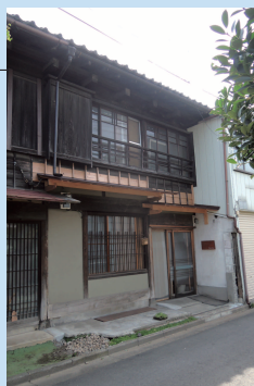
▲ギャラリー・なんとうり

ルート：川越市立美術館 → 弁天横丁ギャラリー・なんとうり → 三番町ギャラリー