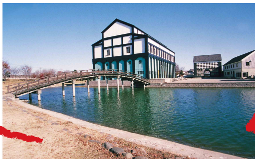
えいしん 盈進学園東野高等学校

設計:Christopher Alexander 春の地域公開実施中。釣りやカヌーもお楽しみいただけます。