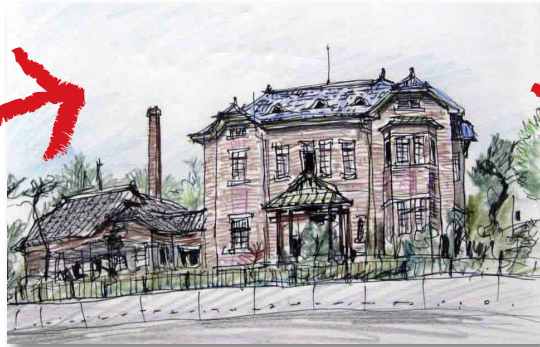
旧石川組製糸西洋館