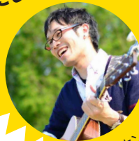
ミュージシャン 大澤加寿彦