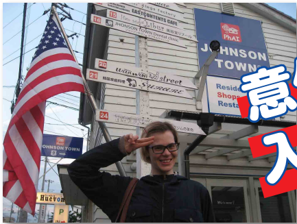
ジョンソントウン

15時解散 入間市駅までのバスが出ますが、そのままジョンソントウンでお楽しみいただくこともできます。16時までワンデーマーケット開催中。