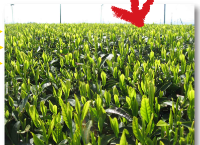
県内一の生産を誇る狭山茶の畑