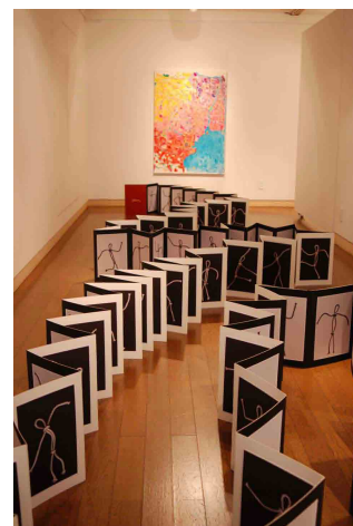
2011年個展 HIRONINNGEN (マキイマサルファインアーツ)