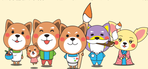
きたうらワンFamily SMFと北浦和西口銀座商店街がコラボして生まれた、アート&地域活性型キャラクター。

SMFのこれまでの活動については、ホームページ http://www.artplatform.jp をご覧ください。お問い合わせは、SMF.info@artplatform.jp までお願いいたします。